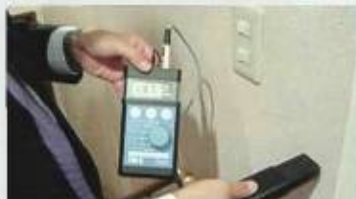
電磁波測定器で屋内配線から発生する電磁場が壁や床に帯電している様子が見られる

「家電や屋内配線による電磁波が健康に影響を与えているのでは」と考え、屋内配線からの電磁場をアースしてその影響を最小限に抑えようとする〈オールアース住宅〉を提案。「一日だけブレーカーを落としてみると、電磁波のない生活が分かる」とのこと。試してみると違いが分かるかも。