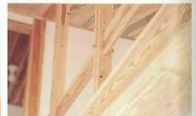
釘を使わない木組みによる家づくりは熟練した職人のなせる技。しっかりと頂丈で見た目にも美しい