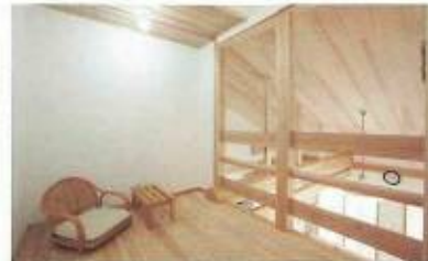
空気が循環するエアバスの家ではリビング上部のフロフトスペースと小屋裏収納も湿気がこもらず快適