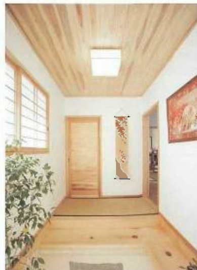
広々とした土間風玄関。正面の扉の奥は靴やコートもたっぷりしまえる収納スペースになっている